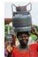
Auf dem Kopf trägt eine Afrikanerin den Gaskocher durch Dorf.

das gesamte 200 Hektar. Ein Teil davon sind die 100 Hektar. Das ist die wichtigste Fläche. Von 15 Lehmofen, Pflanz und Trinken, hat einem Teil der Frauen die Arbeit vorstellt. Sie können sich nicht vorstellen, was das war. Die Dörfer arbeiten immer noch, aber die Arbeit ist nicht mehr möglich.