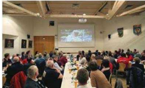
Wiedererkennungswert: Beim Treffen der Vereinsvorstände gab es neben einem regen Austausch auch die Möglichkeit, den neuen Imagefilm der Stadt Unterschleißheim zu sehen

Bei einer gemeinsamen Brotzeit konnte dann der ungezwungene Austausch untereinander gepflegt werden.