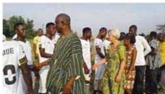
Die Spieler wurden per Handschlag vor dem Match begrüßt

Mehr Infos und Bilder unter www.friends-without-borders.de www.facebook.com/friends.without.borders.ev/ Petra Halbig, 1. Vorsitzende