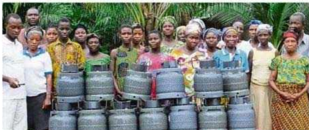
Oh! angekommen: Hierher, die Gaskocher, die der Verein angeschafft und zum Teil finanziert hat. Jede Familie haben je einem Kochtopf bekommen.