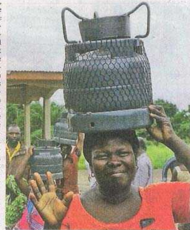
Die Freude war groß, als die Frauen die Gaskocher mit nach Hause nehmen konnten.

Als Alternative wurden Gaskocher zur Verfügung gestellt. Interessierte Familien konnten sich vormerken lassen – letztendlich hat das Los ent-