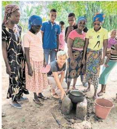
Der Prototyp eines hocheffizienten Kochers ist fertig und wird nun auf Herz und Nieren getestet.

UNTERSCHLEISSHEIM (ph) - In den beiden Dörfern im westafrikanischen Ghana, die der Verein friends without borders unterstützt, werden seit Kurzem Alternativen zu den herkömmlichen Feuerstellen angeboten. Dazu wurde ein Prototyp eines hocheffizienten Kochers hergestellt. Ebenso wurden je zehn Familien