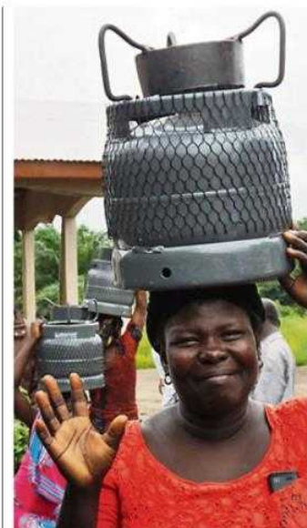
Die Freude war groß, als die Frauen die Gaskocher mit nach Hause nehmen konnten

Traditionell wird in ländlichen Gebieten - so auch in Mafi Dadoboe und Mafi Wute - am offenen Feuer gekocht. Das heißt: Für jede Tasse heißes Wasser wird die offene Feuerstelle genutzt. Feuerholz muss gesammelt werden oder es wird Holzkohle benötigt. Für beide Materialien ist Holz die einzige Energiequelle, die in größeren Mengen beansprucht wird als sie nachwachsen kann. Nicht immer wird nur das abgestorbene Holz aufgesammelt. Und auch für diesen Fall heißt es auf Dauer: Man muss immer weitere Wege zurücklegen, denn die Ressourcen in direkter Nähe sind endlich.