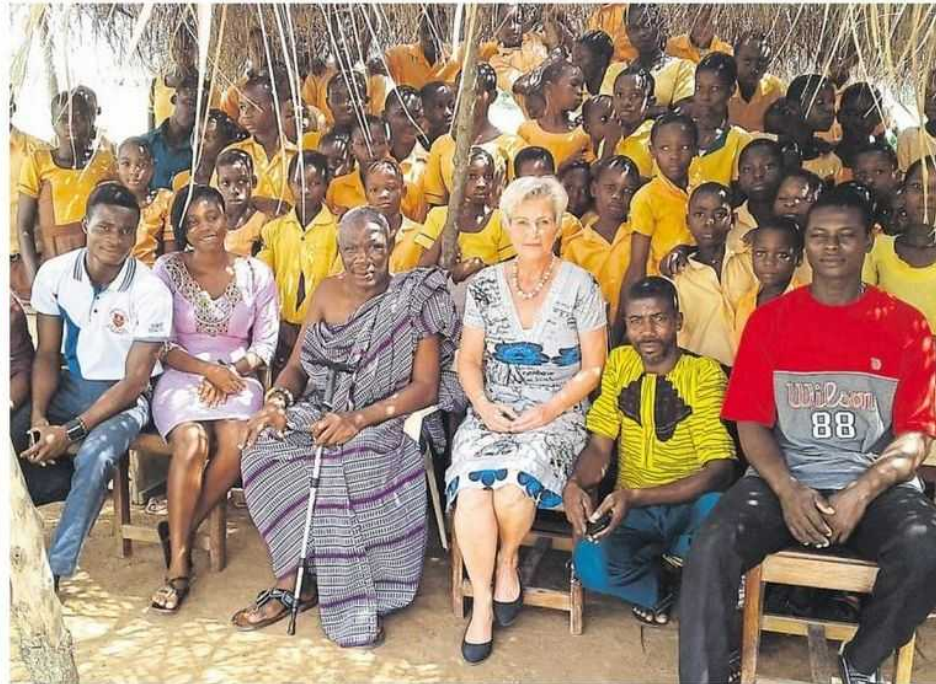
Schüler und Lehrer freuen sich über die Bücher.