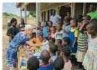
Spandauer machen Freude: Die Spenden, etwa von der Arbeitswelt führt in Unterschleißheim, haben die Kinder geerntet.