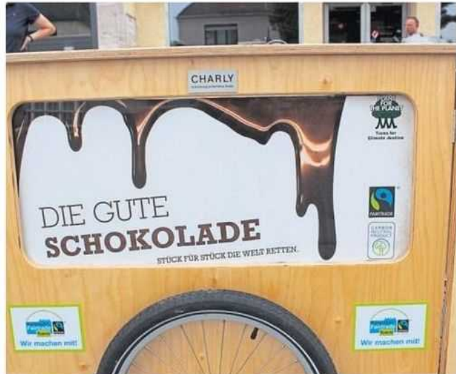
Lecker und vor allem Fair Trade: Die gute Schokolade.

Alle drei Veranstalter, die sich auf verschiedene Weisen mit der Thematik der Armut und der Migration beschäftigen, laden Interessierte zu diesem Abend ein. Vor der Vorstellung, ab 19.30 Uhr findet eine Verkostung gerecht produzierter, von der Fair Trade Stadt Unterschleißheim gesponserten, Schokolade statt. Unter den verschiedenen Sorten