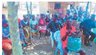
Interessiert hören die Dorfbewohner zu, während der Gaskocher vorgeführt wird