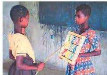
Das Zählen macht mit den neuen Materialien sichlich Spaß.